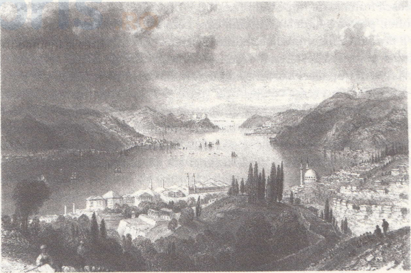
Vedere asupra Bosforului dinspre țărmul asiatic pe deasupra palatului de vară de la Beylerbey

Marmara ne dau impresia unui râu. Cine îi observă însă curenții și contracurenții schimbători, diversele vânturi ce ajută ori îngreunează navigația pe această cale de apă intens circulată, cețurile impenetrabile ce îl înconjoară, chiar și ocazionalele blocuri de gheață care îl gâtuie uneori, realizează pe deplin că face parte dintr-o incontrolabilă mare. Aici s-a luptat Belizarie, generalul lui Iustinian, cu invincibila balenă Porphyrios, acel Moby Dick care timp de luni de zile a sfârșmat toate corăbiile care ajungeau în Bosfor, și tot aici istoricul Gyllius a observat cel mai mare rechin pe care l-a văzut vreodată. Iar în vremurile fericite de odinioară, la mijlocul iernii, grupuri de delfini jucăuși puteau fi zărite croindu-și drum prin strâmtoare, amintindu-ne că delfinul apărea pe unele monede bizantine timpurii. În mitologia greacă, Apollo lua uneori înfățișare de delfin, conducându-i pe navigatori peste mare spre pământuri unde aveau să întemeieze noi colonii, iar, din câte se știe, coloniștii care s-au stabilit în Bizanț au fost îndreptați spre aceste locuri de oracolul din Delfi.