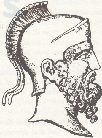
Byzas Megarianul, întemeietorul eponim al Bizanțului; de pe o monedă din Bizanț, aprox. 230–220 î.Hr.

În călătorie, Byzas a consultat oracolul lui Apollo de la Delfi, care l-a sfătuit să se așeze „față în față cu țara orbilor”. Sensul fiind, după cum ne explică Herodot, citându-l pe generalul persan Megabazus, că „oamenii din Calcedon trebuie să fi fost orbi la acea vreme, căci de ar fi avut ochi nu ar fi ales un loc mai prejos, când aveau la îndemână unul mult mai bun”.